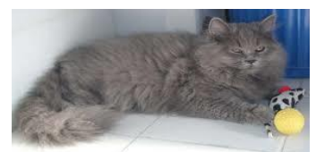
British Long Hair